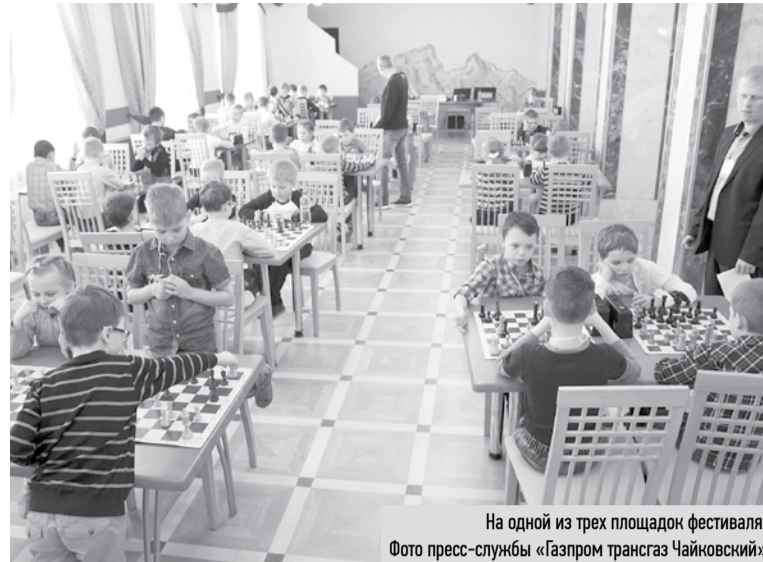
На одной из трех площадок фестиваля.

Лишь постепенно усилия властей, а главное, рост экономики и культуры привели к смягчению нравов.