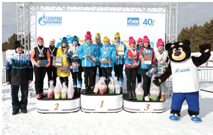
Победители общекомандного зачёта среди женщин