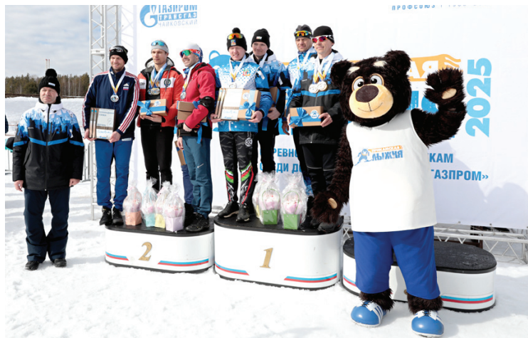
Победители общекомандного зачёта среди мужчин

В составе этой команды – чемпионы и призёры зимних спартакиад ПАО «Газпром», пять спортсменов имеют звание мастера спорта и два – кандидата в мастера спорта по лыжным гонкам. Общество отправило на «Прикамскую лыжню» 3 команды: две мужских и одну женскую. «Переработка – это класс! Побеждать пришёл наш час!» – с таким девизом приехали в Чайковский эти спортивные ребята. И, как показали результаты забегов, это не